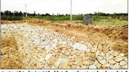
ಮುಳುಬಾಗಿಲಿನ ದೊಡ್ಡಗಾನಹಳ್ಳಿ ಕೆರೆಯಲ್ಲಿ ಉದ್ಯೋಗ ಪಾತ್ರಿ ಯೋಜನೆಯಲ್ಲಿ ನಿರ್ಮಾಣ ಮಾಡಿರುವ ಗೋಕುಂಟೆ ಬೋರ್ಡ್ ಖಾಲಿ ಖಾಲಿ ಹೊಡೆಯುತ್ತಿದೆ.

ಮುಳುಬಾಗಿಲು ತಾಲೂಕಿನ ದೇವರಾಯ ಸಮುದ್ರ ಗ್ರಾಮಪಂಚಾಯತಿ ವ್ಯಾಪ್ತಿಯ ದೊಡ್ಡಗಾನಹಳ್ಳಿ ಕೆರೆಯಲ್ಲಿ ನಿರ್ಮಾಣ ಆಗಿರುವ ಗೋಕುಂಟೆ ಮತ್ತು ರಸ್ತೆ ನಿರ್ಮಾಣದಲ್ಲಿ ಅವ್ಯವಹಾರ ನಡೆದಿದ್ದು ಲಕ್ಷಾಂತರ ರೂ. ದುರ್ಬಳಕೆ ಆಗಿದೆ.