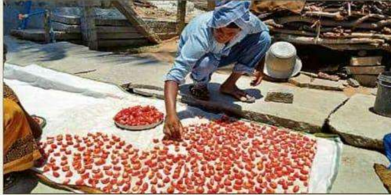
A farmer dries up tomatoes to make tomato flakes in Mulbagal, Kolar district.