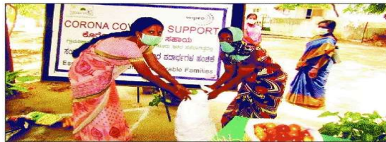
ಬೆಂಗಳೂರು ವಿಪ್ರೋ ಕಂಪನಿ, ಗ್ರಾಮವಿಕಾಸ ಸಂಸ್ಥೆ ವತಿಯಿಂದ ಮುಳುಬಾಗಲು ತಾಲೂಕಿನ ಹೊನ್ನಶೆಟ್ಟಿಹಳ್ಳಿಯಲ್ಲಿ ಕರೋನಾ ವಾರಿಯರ್‌ಗಳಿಗೆ ದಿನಸಿ ಕಿಟ್ ವಿತರಿಸಲಾಯಿತು.

6 ಹೊನ್ನಶೆಟ್ಟಿಹಳ್ಳಿ ಗ್ರಾಮದ 50 ಕುಟುಂಬಗಳಿಗೆ ಈಗಾಗಲೇ ಸಂಸ್ಥೆಯಿಂದ ಆಹಾರದ ಕಿಟ್, ತರಕಾರಿ ನೀಡಲಾಗಿದೆ. ಮಕ್ಕಳಿಗೆ ತಿನಿಸನ್ನೂ ಒದಗಿಸಲಾಗಿದೆ. ಮುಖ್ಯವಾಗಿ ಸಾಮಾಜಿಕ ಅಂತರ, ಮಾರ್ಕ್ ಅಗತ್ಯತೆ ಕುರಿತು ಮನವರಿಕೆ ಮಾಡಿಕೊಟ್ಟು ಜನತೆ ಕಡ್ಡಾಯ ಪಾಲನೆ ಮಾಡುವಂತೆ ನಿಗಾ ವಹಿಸಲಾಗಿದೆ. ಪರಿಹಾರ ಕಾರ್ಡ್‌ನಿಂದ ಅಕ್ಕಿ ಮತ್ತು ಗೋಧಿ ಜನರಿಗೆ ಸಿಕ್ಕಿದ್ದು ದಾನಿಯೊಬ್ಬರೂ ಸಹಾ ಮತ್ತಷ್ಟು ಅಕ್ಕಿ ನೀಡಿದ್ದಾರೆ. ಓಣಗಾಗಿ ಗ್ರಾಮಪಂಚಾಯತಿಯಿಂದ ಆಹಾರದ ಕಿಟ್ ಮತ್ತು ಕೆಲಸ ನೀಡುವಂತೆ ದೇವರಾಯನಹಳ್ಳಿ ಅಧ್ಯಕ್ಷರಿಗೆ ಜನತೆ ಮನವಿ ಸಲ್ಲಿಸಿದ್ದಾರೆ. ಜನತೆ ಬೇಡಿಕೆಯನ್ನು ಬೀಳ್ಕೊಡುವುದರಲ್ಲಿ ಸಂಚಾಲಕರು ಮುಂದಾಗುತ್ತಿರುತ್ತಾರೆ.