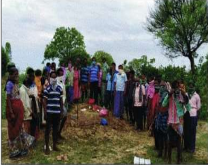
ಕೋಲಾರದ ಮುಳುಗಾಂರಿಯ ದೊಡ್ಡಗಾನಹಳ್ಳಿ ಕೆರೆ ಅಂಗಳದ ಅರಣ್ಯಕೆರೆ ಕಾಮಗಾರಿಗೆ ಉದ್ಯೋಗಖಾತ್ರಿ ಕಾರ್ಮಿಕರು ಚಾಲನೆ ನೀಡಿದರು.

ಇಡೀ ದೇಶಕ್ಕೆ ಕೋವಿಡ್ ಮಾರಿ ಹೊನ್ನ ಸಂದರ್ಭದಲ್ಲಿ ಉಂಟಾದ ಲಾಕ್ಡೌನ್ ನಿಂದಾಗಿ ಹಳ್ಳಿ ಜನತೆಗೆ ಕೆಲಸ ಇಲ್ಲದ ಕಂಠಲಾಗಿತ್ತು ಉಳಿತಾಯ ಪರದಾಡಬೇಕೆಂದಿರುವ ನೆರವಿಗೆ ಬಂದ ಗ್ರಾಮವಿಕಾಸ ಸ್ವಯಂಸೇವಾ ಸಂಸ್ಥೆ ನಾಲವುರು ಬಾರಿ ಹಳ್ಳಿ ಜನತೆಗೆ ಅಪಾರದ ಕೆಲಸ ಮತ್ತು ತರಬೇತಿ ಮತ್ತು ಸೌಲಭ್ಯಗಳನ್ನು ಒದಗಿಸಿತು. ನಂತರ ಗ್ರಾಮವಿಕಾಸದ ಜತೆ ಕೈ ಜೋಡಿಸಿದ ಬೆಂಗಳೂರಿನ ವಿಶ್ವೇಶ್ವರ ಫೌಂಡೇಷನ್ ಸಹಾ ಹಳ್ಳಿಗರಿಗೆ ಅಪಾರದ ಕೆಲಸ ಒದಗಿಸುವ ಮೂಲಕ ಪ್ರಾಣಿ ಉಳಿಸಿಕೊಳ್ಳಲು ನೆರವು ನೀಡುತ್ತಿತ್ತು. ನಂತರ ಲಾಕ್ಡೌನ್ ತೆರವಾದ ದೂರ ಉದ್ಯೋಗವಿಲ್ಲದ ಜನತೆ ಕೆಂಗಾ ಲಾದಾಗ ದೇವರಾಯಸಮುದ್ರ ಪಂಚಾಯತಿ ಸಂಪರ್ಕ ಮಾಡಿದ ಗ್ರಾಮವಿಕಾಸ ಜನತೆಯಿಂದ ಕೆಲಸಕ್ಕಾಗಿ ಅರ್ಜಿ ಹಾಕಿ ದಾಗ ಸ್ವದೇಶ ಸಿಕ್ಕಿದ್ದು ಕೆರೆ ಅಂಗಳದಲ್ಲಿ ಅರಣ್ಯಕೆರೆಗಳ ಕೆಲಸ ಮುಂಜೂರಾಗಿತ್ತು.