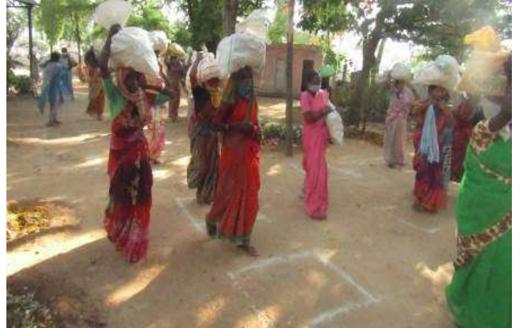
Total number of families and Population who were given food kits till the end of third week